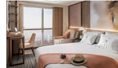
ツインベッド、シャワールーム ベランダ、デスクチェア