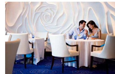
専用ダイニング「ブルー」