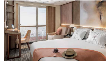
ツインベッド、シャワールーム ベランダ、デスクチェア