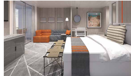
キングサイズベッド、バスタブ付き浴室、音響システム ベランダ、ラウンジチェア ※車いす対応客室はバスタブがなくシャワーのみとなります。