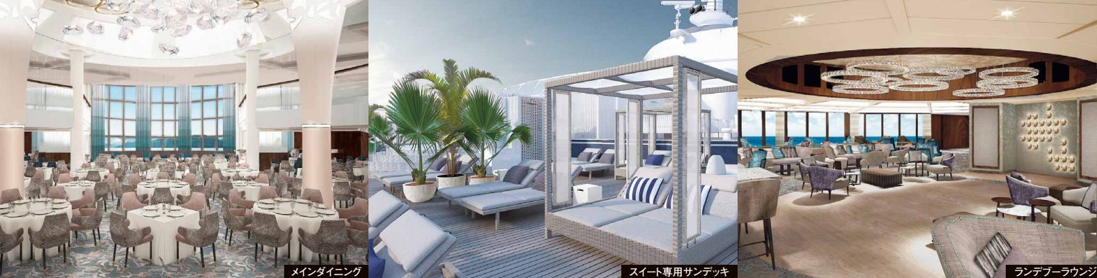
メインダイニング