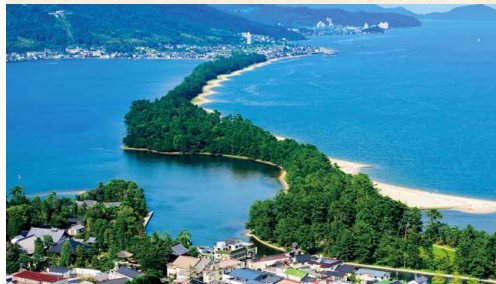
【日本三景】 天橋立【舞鶴】