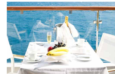
ウェルカムスパークリングワイン