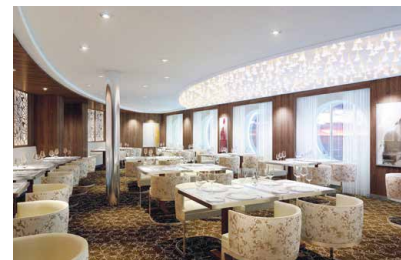
専用ダイニング「ルミナ」