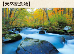
【天然記念物】 奥入瀬【青森】