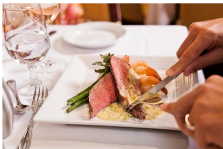
＜メインダイニングお食事の例＞

スペクトラム・オブ・ザ・シーズでは、世界中のお料理を多様なレストランでお楽しみいただけます。3階建ての荘厳なレストラン「メインダイニング」ではアラカルトで国際色豊かなお料理の数々をお召し上がりいただけます。スペシャリティレストランも充実しており、世界的にも有名なセレブリティシェフ ジェイミー・オリバーが手掛ける「ジェイミーズ イタリアン」、日本料理「イズミ」に加え、本場の四川料理を味わえる「シーチュアンレッド」などが新設されます。