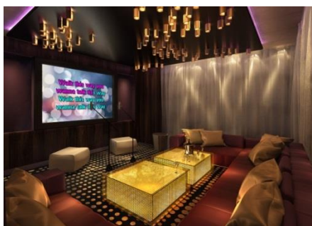
＜スターモーメント＞