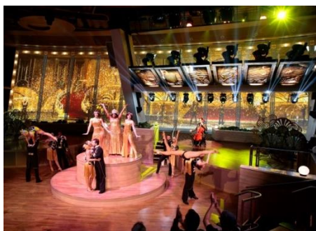
＜トゥセブンティでのショー＞