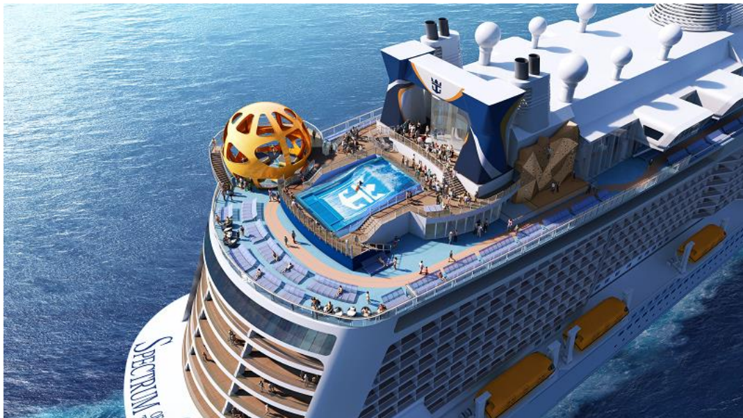
上空からのスペクトラム・オブ・ザ・シーズ（完成予想図）

東京、2018年9月7日 グローバルに展開するクルーズ会社ロイヤル・カリビアン・インターナショナル社の新造船スペクトラム・オブ・ザ・シーズが、世界が注目する東京2020オリンピック・パラリンピック競技大会の年にオープンする「東京国際クルーズターミナル」の記念すべき初入港、第1船目になることが決まりました。スペクトラム・オブ・ザ・シーズの輝かしい初入港は、開業日2020年7月14日になります。