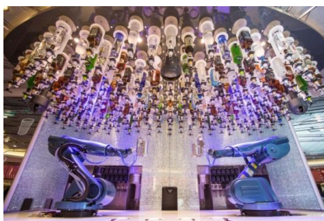
＜バイオニックバー＞