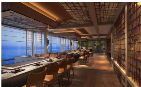
＜日本食レストラン＞